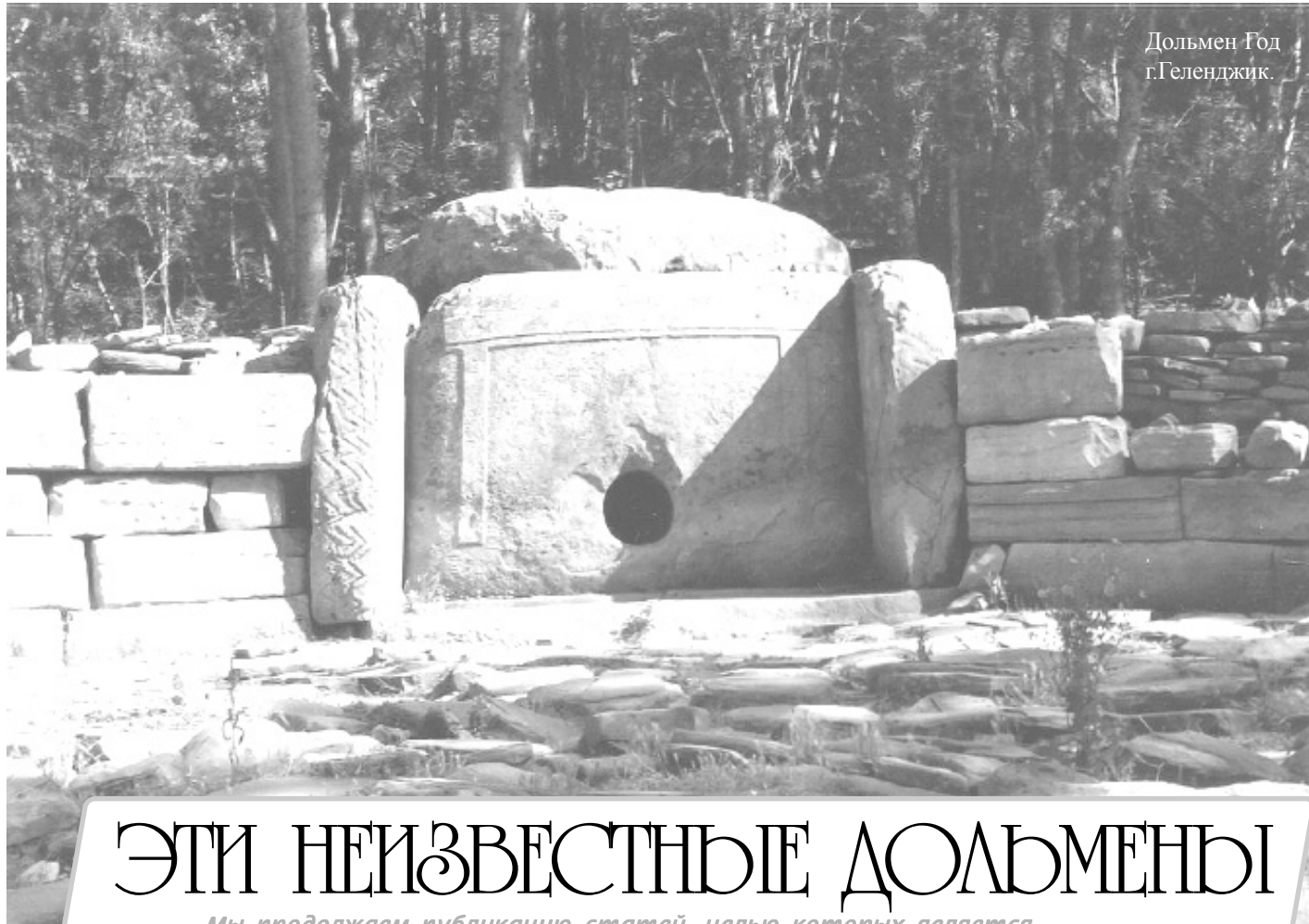
Дольмен Год г.Геленджик.

Учредители: ОРООЗ «Радуга», МРОО «Родина», ТРООЗ «Планета - наш дом», СОО «Возрождение», ЛОО «Сотворение», ВРОД «Лада», ЭОП «Благо-Дать».