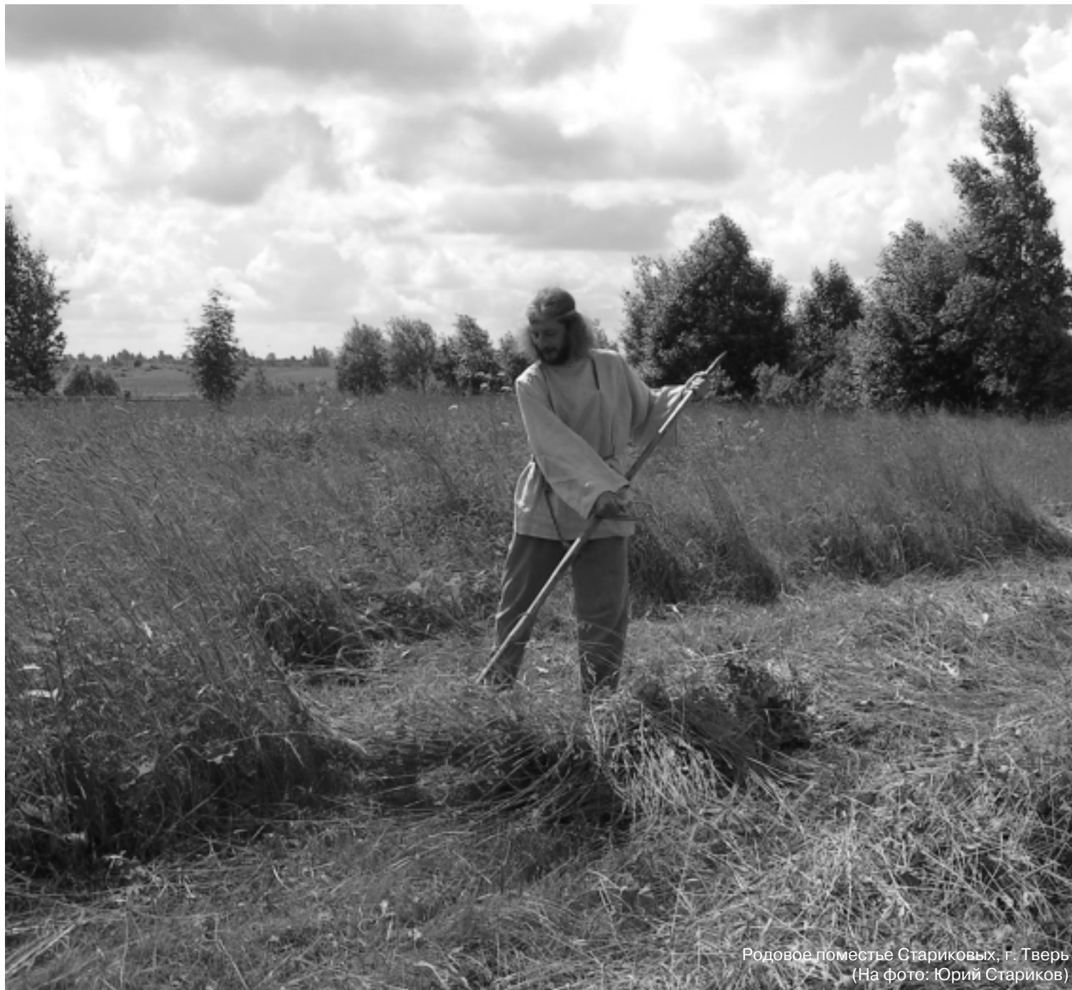
Родовое поместье Стариковых, г. Тверь (На фото: Юрий Стариков)