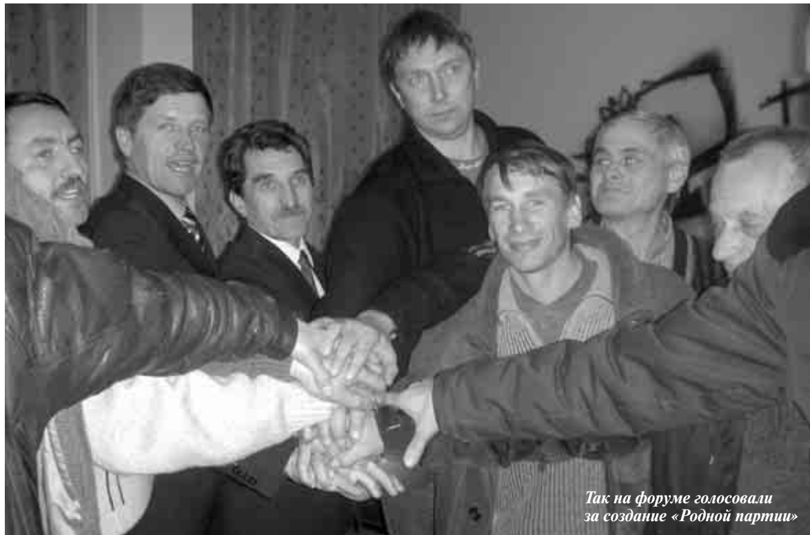
Так на форуме голосовали за создание «Родной партии»