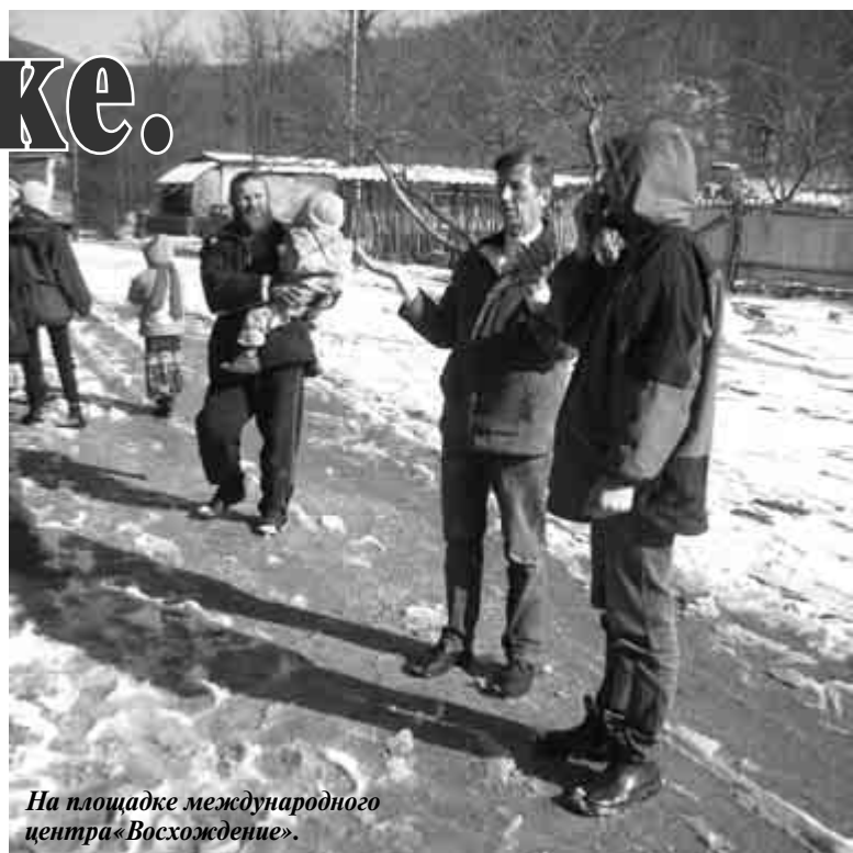
На площадке международного центра «Восхождение».