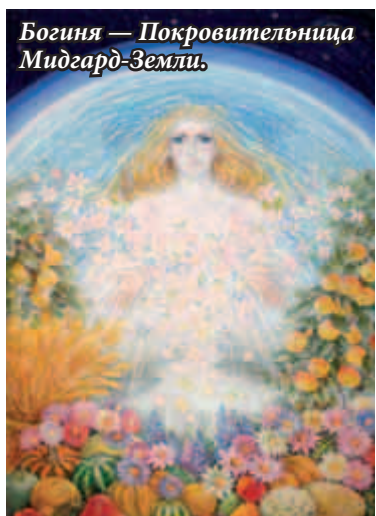
Богиня — Покровительница Мидгард-Земли.