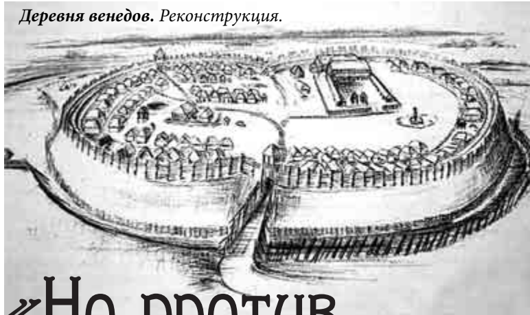
Деревня венецов. Реконструкция.