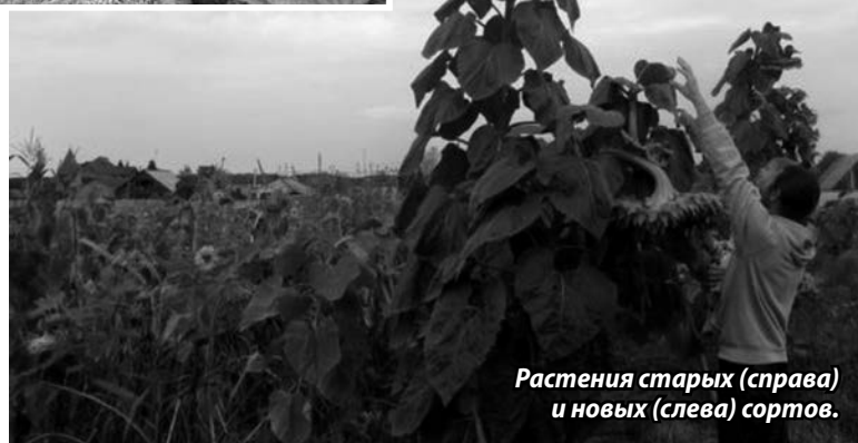
Растения старых (справа) и новых (слева) сортов.

При поверхностном взгляде казалось, что творится полный хаос. Но если присмотреться, можно увидеть много интересного. По подсолнуху вьются плети огурцов, я даже их туда не направлял — они сами вились.