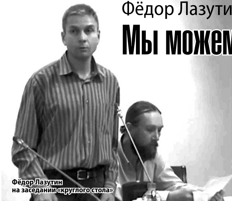
Фёдор Лазутин на заседании «круглого стола»