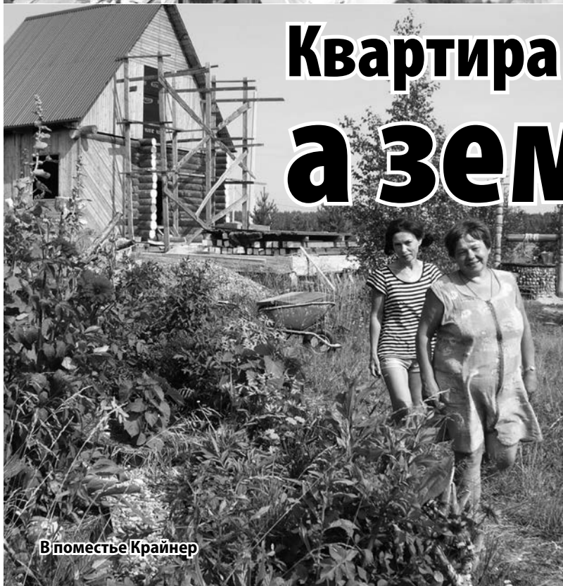
В поместье Крайнер