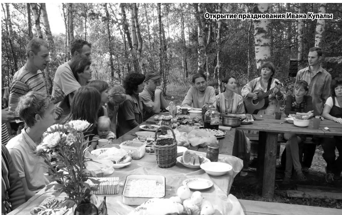
Открытие празднования Ивана Купалы